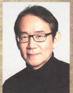
周防正行(映画監督)